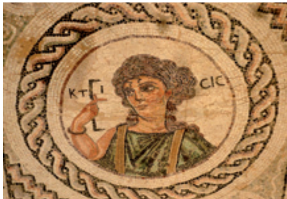
Ktisis. Personalisierung der Erschaffung der Welt (mit Standardmaß römischer Fuß), Haus des Eustolios, Kourion. Zypern, 4. Jhdt. u. Z.