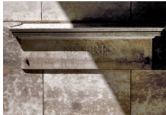
Mètre étalon (1796/1797) | 36, rue de Vaugirard, Paris